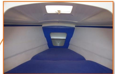
Cabine double avant