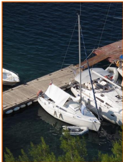
Annexe, taud de soleil, table cockpit, douchette extérieure, etc.