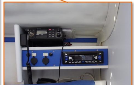
VHF (ASN), radio Bluetooth, prises USB