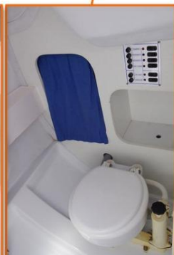
WC marin + lavabo